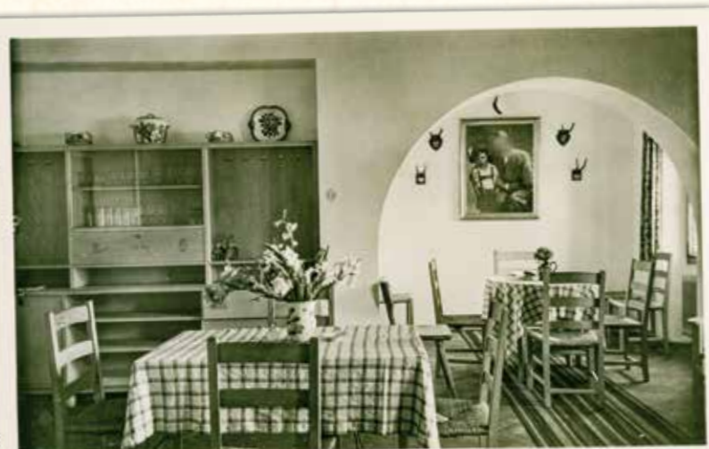
Alpen-Fremdenheim Bartels, Hintersee 620 m ü. M.

Nach dem Polenfeldzug im Herbst 1939 wurde das Haus im darauffolgenden Frühjahr 1940 von Gebirgsjägern bewohnt. Sie verweilten im Alpenhof bis zum Frankreichfeldzug. Ab dem Jahr 1941 war die Kinderlandverschickung (KLV-Lager aus Hamburg und Recklinghausen) im Alpenhof. Bis zum Jahr 1945 wurden das Haus von diesen genutzt, da die Städte den starken Bombardierungen ausgesetzt waren.